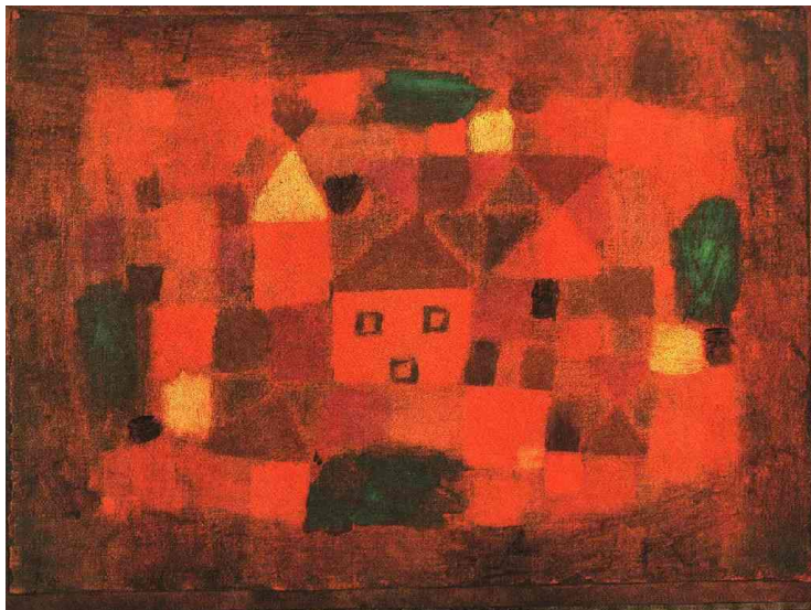
Пейзаж с закатом, 1923

Паул Клей ижоди билан танишинг. Келтирилган асарларни яхшилаб куздан кечиринг ва шу рассом ижодига мансуб иккита асарни (расмни) чизиб синф кургазмасига тайёрланг.