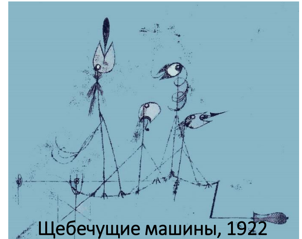
Щебечущие машины, 1922